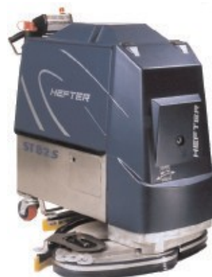
ST82 S VARIOTECH®

Tel.: +49 (0 80 51) 686-0 Tel.: +49 (0 80 51) 686-179 E-Mail: cleantech@hefter.de www.hefter.de